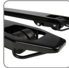
A villacsúcsok csúszó kengyelei megkönnyítik a raklap alá való betolást és az onnan való kihúzást.