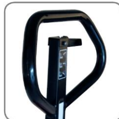
Az ergonomikus kormányrúd kényelmes fogást biztosít.