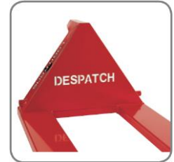
Kivágható szöveg/név/logó a háromszögből és speciális szín rendelése lehetséges.