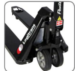
A Panther Silent folyamatos gyorsemeléssel rendelkezik.

Szívesen kínálunk Önnek testre szabott megoldásokat is. Látogassa meg a www.novotransz.hu weboldalt.