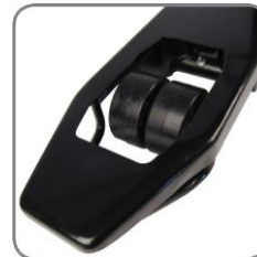
Az ikergörgők optimális forgatást biztosítanak.