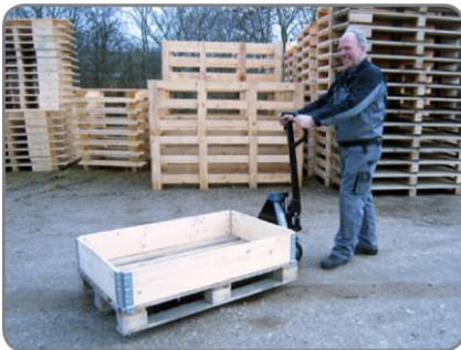
Áruszállítás a szabadban laza talajon! Panther Silent raklapemelőnkkel ez nem gond.