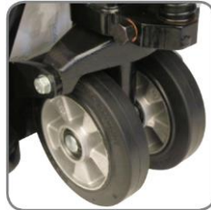
A speciális gumi kerekek kímélik az érzékeny padlóburkolatokat.