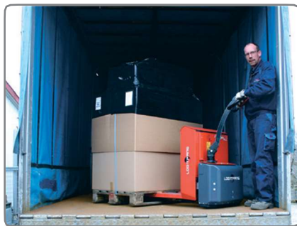
A Panther Maxi (1800 kg-os teherbírás) a nehéz raklapok mozgatásához javasolt, pl. fuvarozó ipar.