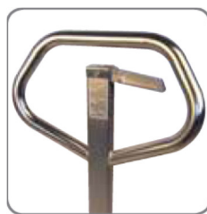
Az ergonomikus kormányrúd biztosítja a felhasználó számára a laza fogást.