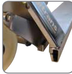
A kétoldalt nyitott vagy teljesen zárt üregek hatékony tisztítást tesznek lehetővé