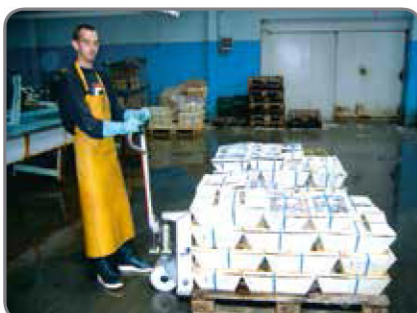
Inox - az élelmiszeripar számára olyan munkaterületekre, ahol fontos a korrózióállóság.