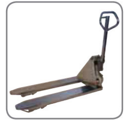
A Panther Inox Plus robbanásbiztos kivitelben is kapható.