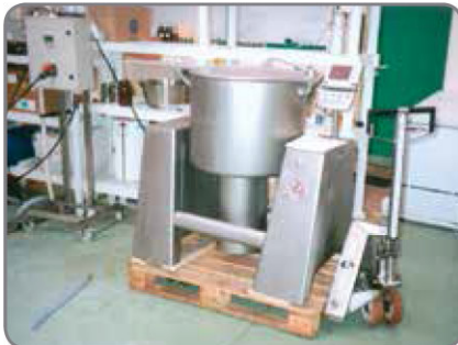
Inox Plus - az élelmiszer- és gyógyszeripar számára nagy igényekkel a higiéniával és a tisztíthatósággal szemben.