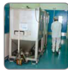
A villás raklapemelő itt a gyógyszeriparban