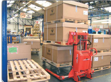
Az erős konstrukció hosszú élettartamot és alacsony karbantartási költségeket biztosít.

**** A tesztek szerint 1700 mm elegendő - a terpeszlábak közötti szélességtől függően.