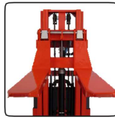
Különbő hosszúságú és típusú, állítható villák rendelhetők hozzá.