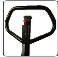
Az ergonomikus kormányrúd kényelmes fogást biztosít a felhasználó számára. A kormányrúd a név/részleg elnevezésével jelölhető.