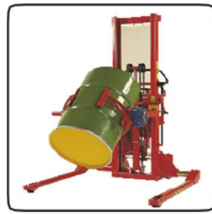
Oldalra dönthető villákkal és/vagy olyan opcionális extra tartozékokkal rendelhető, mint a hordófordító, távirányító, színtszabályozó, darukar.

Manuális és elektromos emelési móddal egyaránt rendelhető.