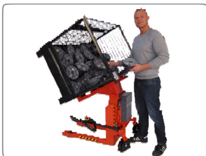
A kormányrúd elfordítható úgy, hogy a felhasználó szabadon hozzáférhessen a rácsos konténer vagy a tartály tartalmához.

A robusztus konstrukció hosszú élettartamot és alacsony karbantartási költségeket garantál.