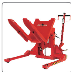
A széles nyomtávú alváz Logitilt sokféle típusú raklapot kezel - zártakat is.