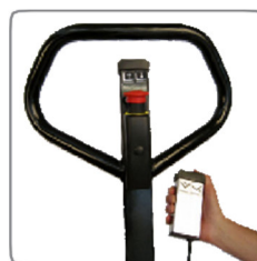
A billentési funkciót vezetékes távirányító vezérli.