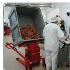
Korrekt munkavégzési tartás a rácsos konténer és ládák - mind ülő, mind álló helyzetben történő - üritésekor.