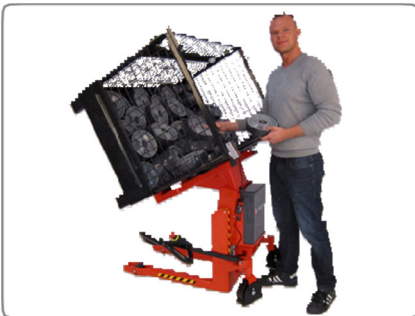
A kormányrúd elfordítható úgy, hogy a felhasználó szabadon hozzáférhessen a rácsos konténer vagy a tartály tartalmához.

A robusztus konstrukció hosszú élettartamot és alacsony karbantartási költségeket garantál.