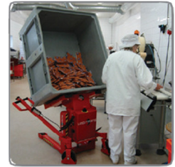
Korrekt munkavégzési tartás a rácsos konténerek és ládák - mind ülő, mind álló helyzetben történő - üritésekor.