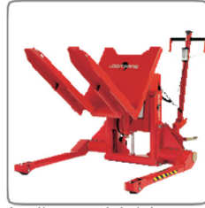
A széles nyomtávú alváz Logitilt sokféle típusú raklapot kezel - zártakat is.