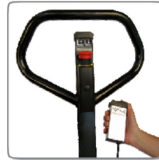
A billentési funkciót vezetékes távirányító vezérli.