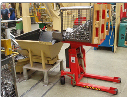
Itt a Logitilt készüléket az alkatrészgyártásban használják.