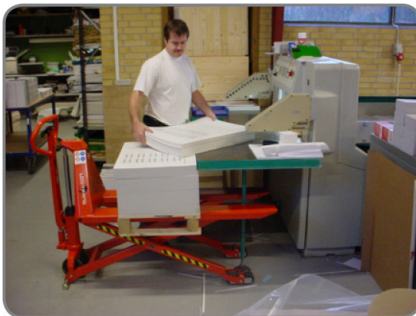
Kézi ollós raklapemelő nagyon kis pumpálási erővel, lábvédelemmel és semleges pozícióval.

* A teherbírás 470 mm emelési magasságtól 1500 kg-ról 1000 kg-ra csökken.