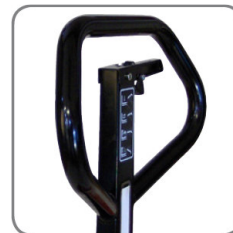
Az ergonomikus alakú kormányrud kényelmes fogásról gondoskodik.