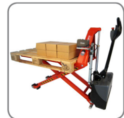
A pozíciósabályozó (tartozék) állandó munkamagasságot tart.