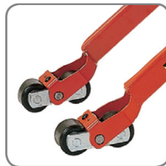
A tandem villagörgők befékezési biztosítással rendelkeznek és kímélik a padlót.