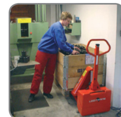
A szabadalmaztatott munkahenger konstrukció alacsony szerkezeti magasságot biztosít.

Szívesen kínálunk Önnek ügyfél-specifikus megoldásokat is. Látogassa meg a www.novotransz.hu weboldalt is