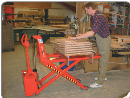
Tartozékok: távirányító, pozícióvezérlés, fék, töltőkészülék (külső vagy beépített).