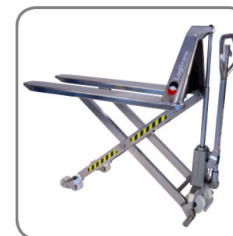
Kézi, elektromos, rozsdamentes és robbanásbiztos.