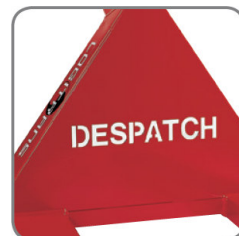
A kormányrud a név/részleg elnevezésével jelölhető.